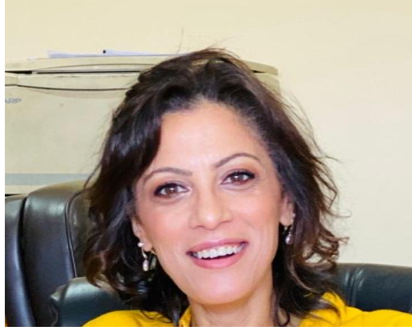
عميد الكلية أ.د/ مروة محمد وجدي الشريبني